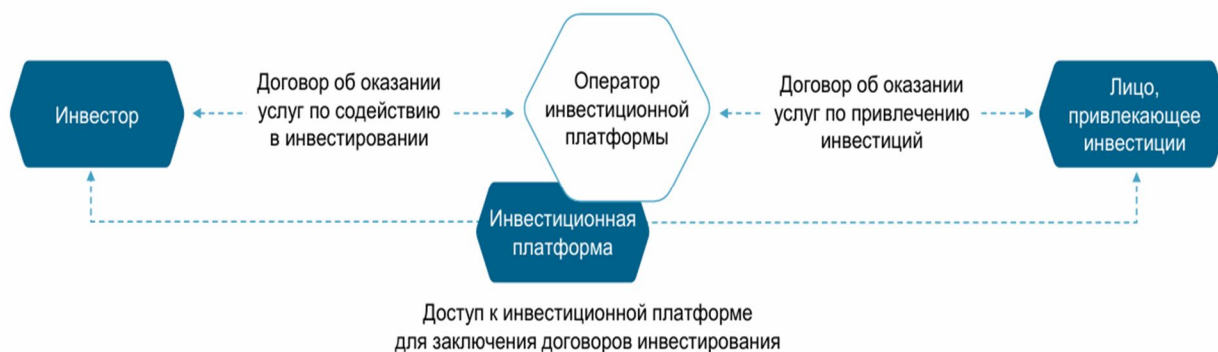
Рис. 1. Механизм процесса привлечения инвестиций на инвестиционной платформе [8]

Как видно на рисунке 1, участники процесса краудфандинга – это: