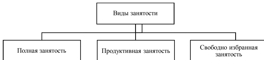
Рис. 2. Виды занятости

Важное аналитическое значение имеет классификация видов занятости (рис. 2).