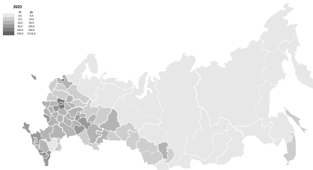
Рис. 1. Плотность населения в регионах России, чел. / кв. км

По данным Росстата, численность населения страны на начало 2023 года составляла порядка 146,4 млн человек, которые были распределены по территории крайне неравномерно. При средней плотности населения в 8,55 чел./кв. км, данный показатель варьируется от 0,07 в Чукотском автономном округе до 5116,82 в г. Москве. Неудивительно, что наибольшая плотность населения наблюдается в городах федерального значения и Московской области. Следующая группа регионов с плотностью населения свыше 70 чел./кв. км представлена в основном субъектами Северо-Кавказского и Южного федерального округов. Далее в рейтинге значительную долю начинают занимать регионы Приволжского и Центрального федеральных округов. Наиболее низкие показатели плотности населения характерны в основном для регионов Дальневосточного федерального округа. Таким образом, на рисунке 1 отчетливо проявляются так называемые основная зона расселения и зона Севера, исторически сложившиеся под влиянием разнородных факторов. Более того, на протяжении последних лет поляризация продолжает возрастать.