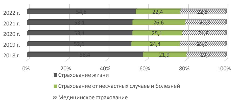
Рис. 2. Структура страховых взносов по добровольному личному страхованию в РФ, % [4–7]

При этом структура страховых взносов по добровольному личному страхованию, представленная на рисунке 2, показывает, что за анализируемый период снизился интерес страхователей к страхованию жизни. Доля данного сегмента сократилась с 58,4 % в 2018 г. до 54,8 % в 2022 г. Повысилась доля медицинского страхования с 21,9 % до 22,4 % и страхования от несчастных случаев и болезней с 19,7 % до 22,8 %.