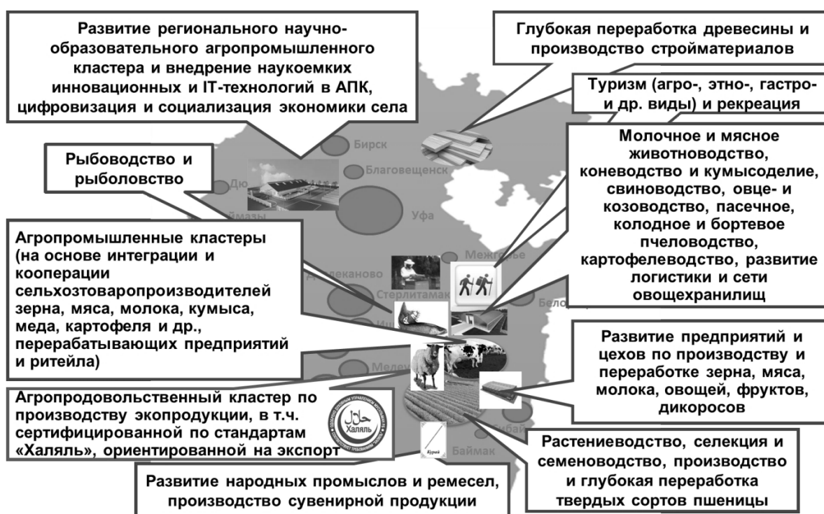
Рис. 3. Приоритетные «точки роста» экономики сельских районов Республики Башкортостан

Институт социально-экономических исследований УФИЦ РАН обладает ресурсами и опытом для разработки и научно-методического сопровождения стратегий, концепций, бизнес-планов, технико-экономического обоснования проектов развития экономики села. На рисунке 3 нами приведены приоритетные «точки роста» экономики сельских территорий РБ, в том числе юго- и северо-восточных районов, которые уже долгие годы относятся к категории депрессивных и дотационных.