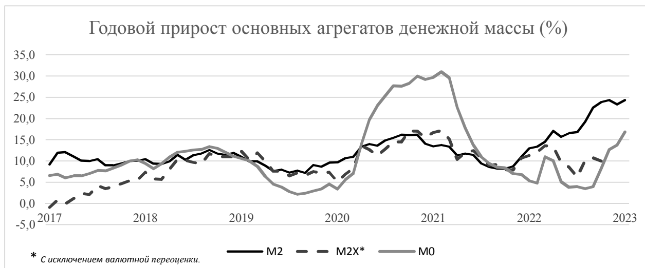
Рис. 2. Динамика объема денежной массы в экономике России [5].

Главное направление антиинфляционной политики Правительства РФ на современном периоде развития российской экономики – это применение инструментов денежно-кредитной политики с целью обеспечения контроля объема денежной массы, динамика за последние 6 лет которой изображена на следующем графике (см. рис. 2).