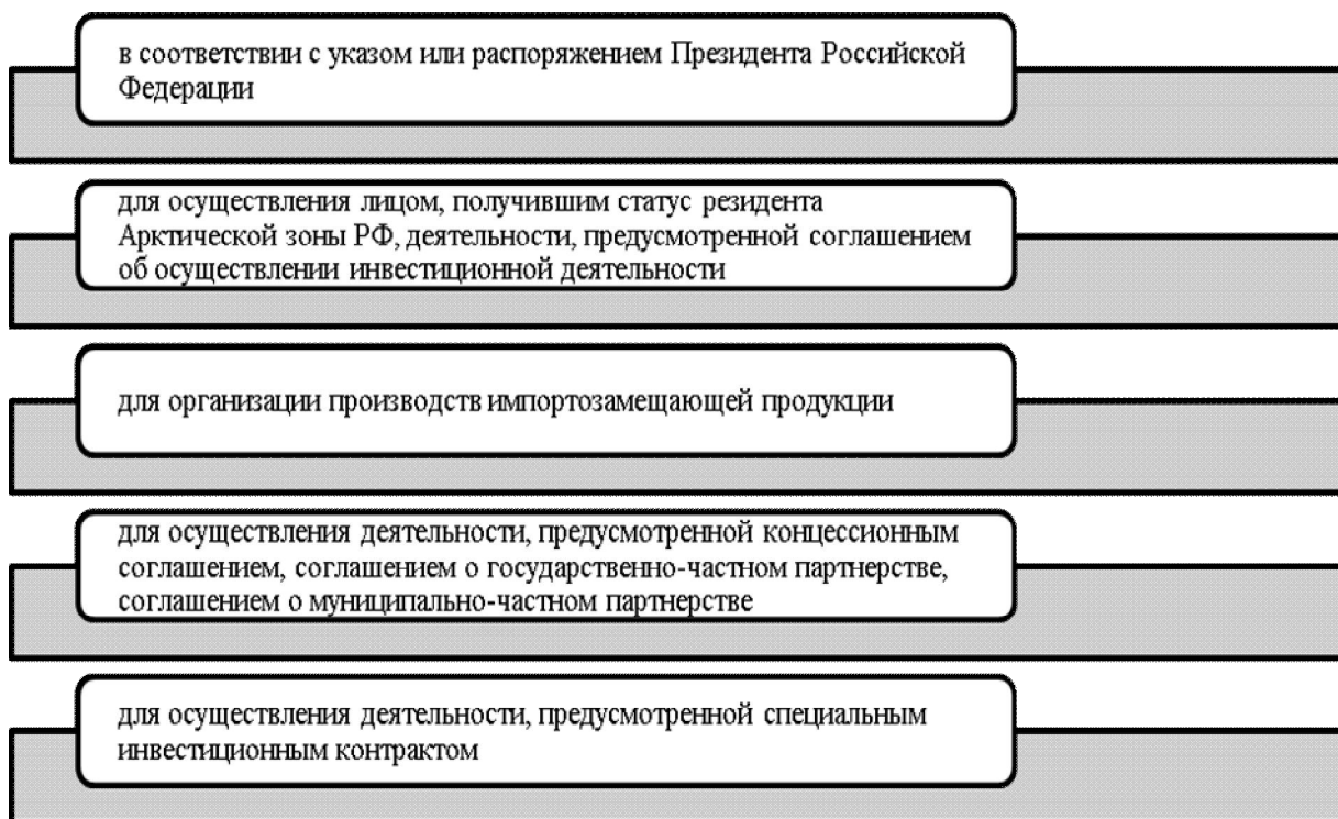
Рис. 2. Основания для предоставления земельных участков в аренду без необходимости проведения торгов

6. Имущественная поддержка. В регионе действует система предоставления земельных участков в аренду без проведения торгов. Выдача участков может осуществляться по ряду оснований (рис. 2):