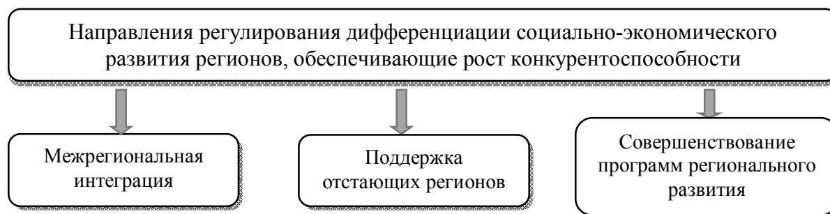
Рис. 1. Направления повышения конкурентоспособности и снижения территориальной дифференциации

Минимизировать данные угрозы и сгладить различия между регионами могут помочь различные методы регулирования социально-экономического развития. Изучив различные источники информации по региональной тематике, составлена оптимальная комбинация мероприятий (рис. 1), реализация которых позволит решить выявленные проблемы или снизить их остроту.