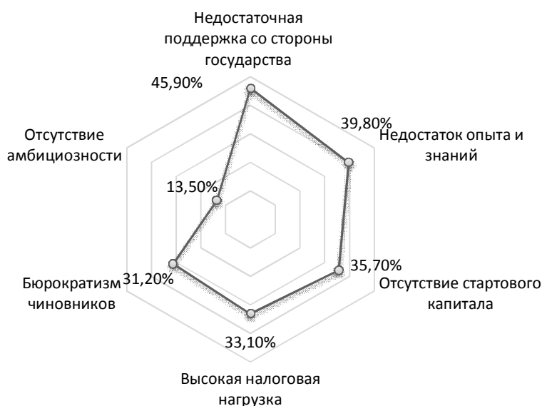
Рис. 3. Проблемы, возникающие при ведении предпринимательской деятельности, по мнению студенческой молодежи (%)

Благоприятное впечатление о предпринимателе и его деятельности у окружающих создают определенные поступки и действия. Так, студенты считают, что предприниматель должен выпускать качественную продукцию – этот вариант отметили 78,6 % из всех опрошенных респондентов, платить своим сотрудникам достойную заработную плату (41,7 %), соблюдать законодательство (23,7 %) и заниматься благотворительностью (10,5 %).